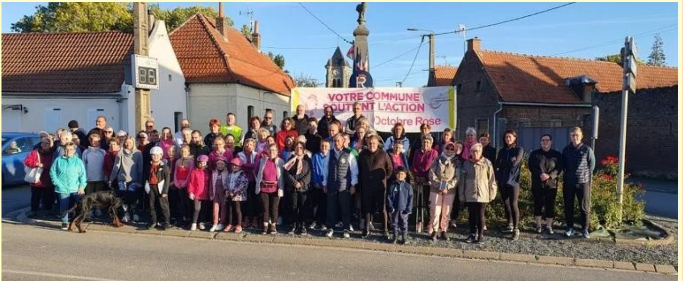
Marche organisée à Fressies le 22 octobre à l'occasion de la campagne « Octobre Rose ». Une collecte a été réalisée et a rapporté 220 € au profit de EMERA.