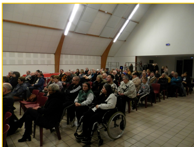
Une partie de l'assistance