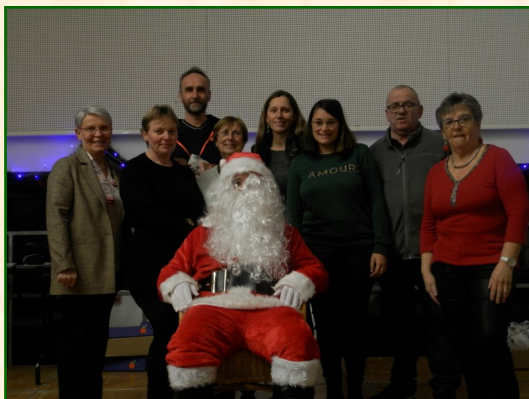
Le Père Noël et les membres du conseil...