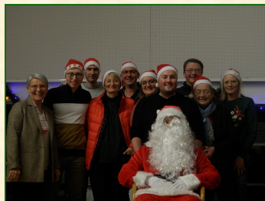
... et du comité des fêtes.