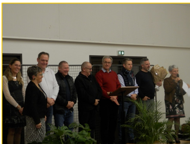
Madame le Maire et le conseil municipal

La sympathique manifestation s'est terminée par le traditionnel verre de l'amitié.