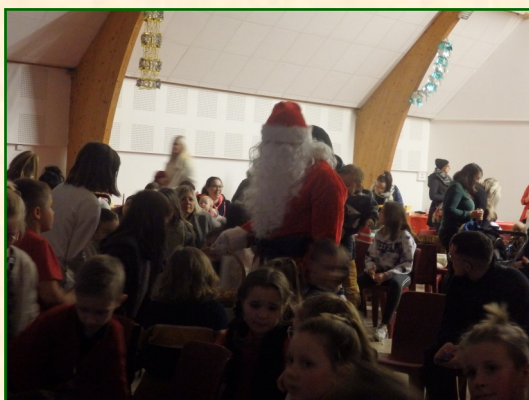
L'arrivée du Père Noël