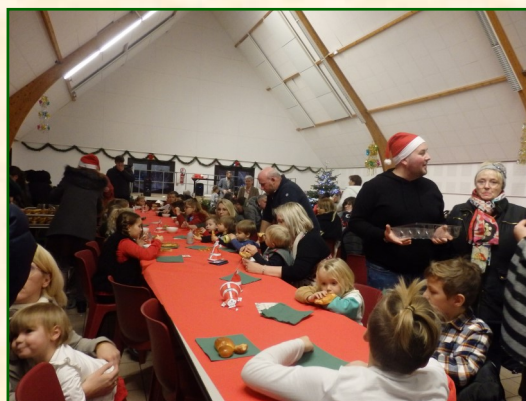
Le goûter à l'issue de la remise des cadeaux.